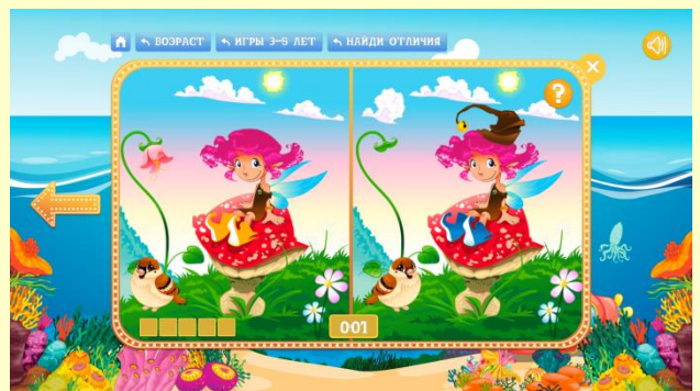
Игра «Найди отличия»