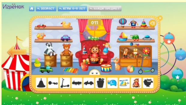
Игра «Найди предмет»